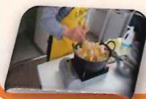
クッキングの様子